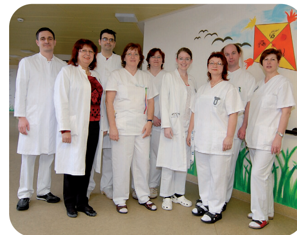
Das Team der Chirurgischen Klinik IV

Zur Seite steht ihr ein erfahrenes und engagiertes Team aus Oberarzt, Assistenzärzten, Anästhesisten, Radiologen und dem Pflegepersonal.