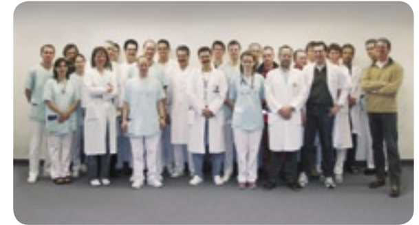
Das Team des Instituts für Anästhesie und Intensivmedizin

Das Institut für Anästhesie und Intensivmedizin steht unter der Leitung von Direktor