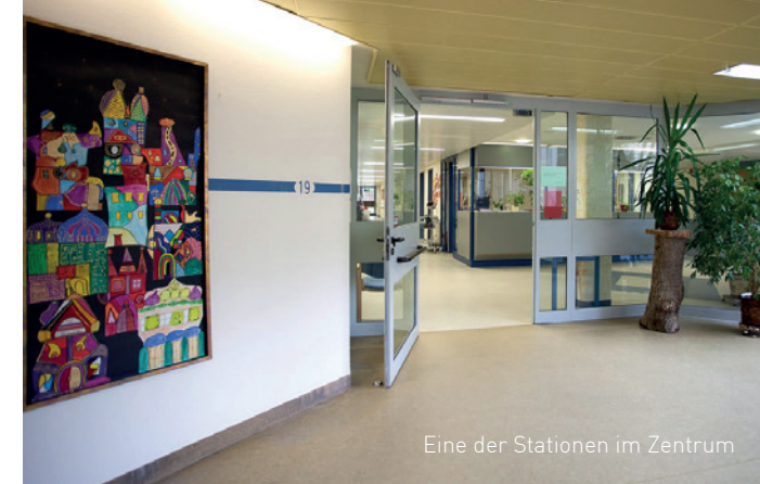
Eine der Stationen im Zentrum

Das Zentrum verfügt über zwei Chefärzte und eine große Anzahl von qualifizierten Ober- und Fachärzten, psychologischen Psychotherapeuten und Pflegekräften mit Zusatzqualifikation. Wir verfügen über eigene Dozenten und Supervisoren und bilden Fachärzte, Therapeuten und Fachpflegepersonal aus. Die Behandlung von psychischen Störungen und psychiatrischen Erkrankungen ist am erfolgreichsten, wenn Patient, Arzt, Psychotherapeut und das gesamte Behandlungsteam zusammenarbeiten und Unterstützung in der weiteren Umgebung des Kranken erfahren.